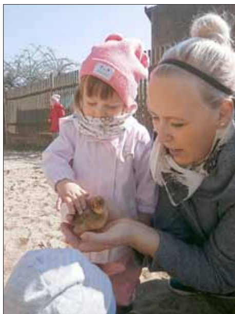
Die Kinder und Erzieher aus dem Kinderhaus Rottleben