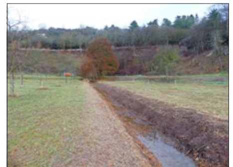
Ein Graben als Lebensraum für die Helm-Azurjungfer bei Rottleben

Die Projekte wurden über das Programm zur Förderung von Maßnahmen des Naturschutzes und der Landschaftspflege in Thüringen (NALAP) umgesetzt und mit Mitteln des Freistaates Thüringen und Bundesmitteln der Gemeinschaftsaufgabe „Verbesserung der Agrarstruktur und des Küstenschutzes“ (GAK) finanziert. Die praktischen Arbeiten wurden von der Firma Gebhardt Garten- und Landschaftsbau ausgeführt.