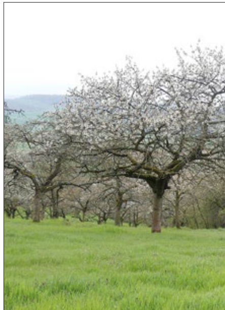
Streuobstwiese am Weinberg bei Bendeleben

Von November 2022 bis Mai 2023 betreute die Natura 2000-Station die Pflege zur Biotop-Aufwertung an zwei Gräben nahe der Barbarossa-Höhle bei Rottleben. Hier wurde ein Laichhabitat für die vom Aussterben bedrohte Kreuzkröte geschaffen. Außerdem werteten eine Schilfmahd und die anschließende Bepflanzung mit Brunnenkresse den Lebensraum der gefährdeten Kleinlibelle Helm-Azurjungfer an einem anderen Graben auf. Diese Libellenart benötigt besonnte Gräben mit wintergrünen Wasserpflanzen zur Eiablage und Entwicklung ihrer Larven.