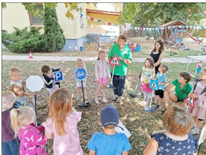
Verkehrsschulung in der Kita „Kinderhaus“ Rottleben