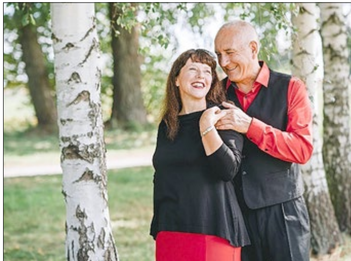
Duo „con emozione“

Es erwartet Sie ein schwungvolles Konzert mit dem Duo „con emozione“