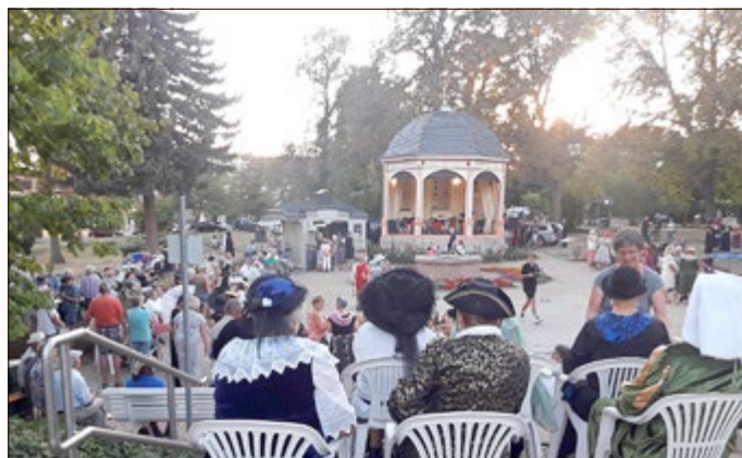
Impressionen vom Kurkonzert und Kurmilieu 2022

Mittwoch, 30.08, um 19.00 Uhr, am Konzertpavillon im Kurpark „Kurkonzert und Kurmilieu“