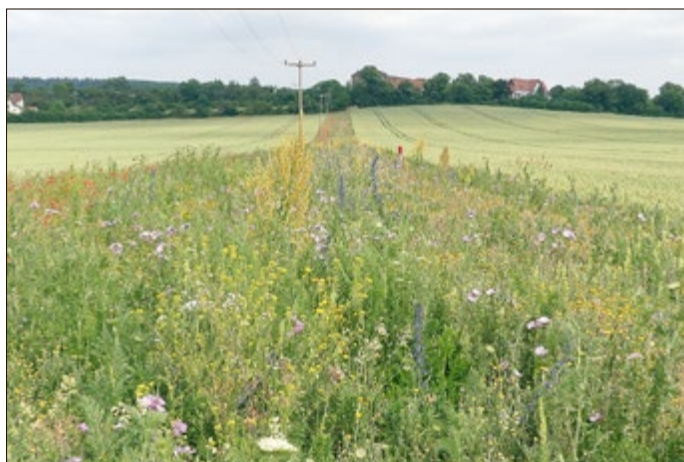
Abbildung 1, Blühaspekt eines neu angelegten Feldrains bei Heygendorf im ersten Standjahr

Die Förderung des Verbundprojektes erfolgt im Bundesprogramm Biologische Vielfalt durch das Bundesamt für Naturschutz mit Mitteln des Bundesministeriums für Umwelt, Naturschutz, nukleare Sicherheit und Verbraucherschutz. Weiterhin beteiligen sich das Thüringer Ministerium für Umwelt, Energie und Naturschutz, die Stiftung Naturschutz Thüringen sowie die Natura 2000-Station Südharz/ Kyffhäuser.