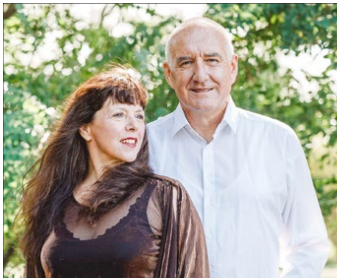
Duo ›con emozione‹

Zum Neuen Jahr startet das Regionalmuseum Bad Frankenhausen traditionsgemäß mit dem Duo ›con emozione in das Veranstaltungsjahr.